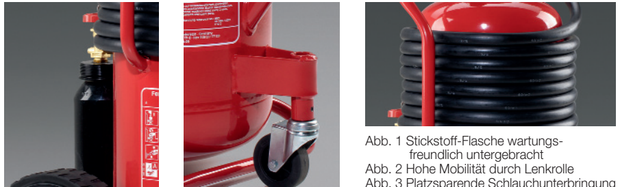
Abb. 1 Stickstoff-Flasche wartungsfreundlich untergebracht Abb. 2 Hohe Mobilität durch Lenkrolle Abb. 3 Platzsparende Schlauchunterbringung